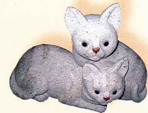
Katzenpaar 27 cm hoch · Preis: 225 €