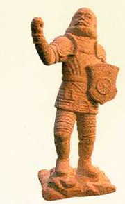
„Götz“ in handlicher Größe 32 cm hoch · Preis: 155 €