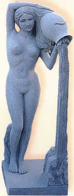
Wasserträgerin 180 cm hoch · Preis: 2.990 €