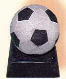
Fußball mit Sockel 12 cm hoch · Preis: 29 €

In Stein können wir alle Formen und Größen realisieren. Ein kleines Spektrum unseres Angebots: