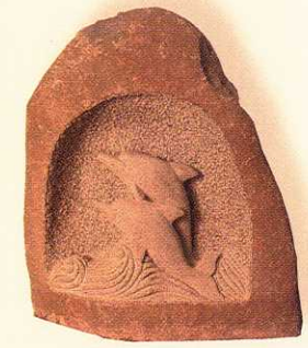
Delfine im Kiesel 75 cm hoch · Preis: 265 €